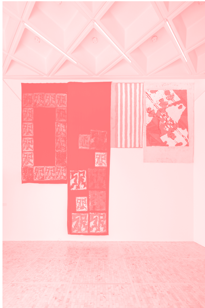
SR LAUNDRY, 2019 Lino, algodón, pintura textil inflable

En cierto sentido, es como si las piezas de arte crearan imágenes a través del verso libre. No existe materia o ritmo regular, se basa en pausas y frases naturalmente rítmicas. Ekblad ha señalado que “A veces las obras nacen de la escritura: los títulos de las obras vienen de poemas, y a veces los poemas se moldean en canciones y se esconden dentro de pinturas”. Esto es notorio en obras que usan una tipografía clásica para escribir poesía caótica, como en el caso de Sportswear , 2019 ( Ropa deportiva ) o en el ejemplo contrario con Liar Liar , 2017 ( Mentiroso, mentiroso ), en donde las letras con el estilo grafiti son colocadas en un lienzo de lino tradicional.