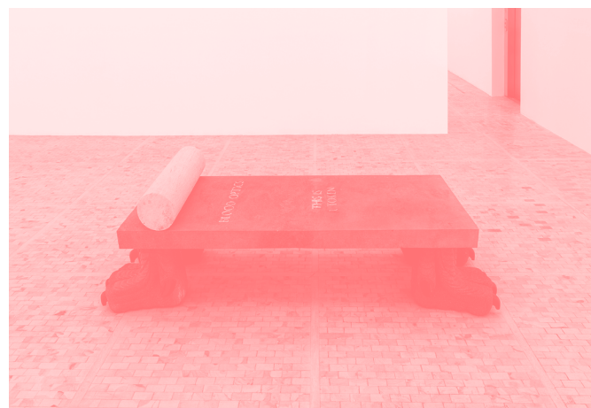
Blood Optics , 2019 Ópticas sanguíneas Recinto de lava, piedra volcánica, recinto pachuco, estaño

Las cosas que han hecho y en las que se esconden Plastisol y pintura textil inflable sobre lino