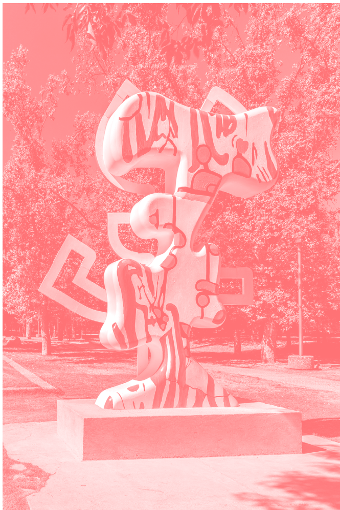
Tortoise With A Sail , 2019 Tortuga con una vela Fibra de vidrio, pintura de aceite, gelcoat

Basándose en una serie de impulsos históricos del arte como Odilon Redon, Paul Thek, Paula Modersohn-Becker, Marie Laurencin, Harriet Backer, Florine Stettinheimer, Helen Frankenthaler, el movimiento vienés Wiener Werkstätte y las artesanías nórdicas, la artista los mezcla de forma impredecible con elementos de las culturas marginales contemporáneas como estampados textiles, revistas vintage, estufas tradicionales de hierro fundido, jeroglíficos de grafitis, diseño gráfico japonés de finales del siglo XX, steam punk , cubiertas de vinilo, deviant art , etc. Recientemente, la obra de Ekblad se ha centrado en el estudio de archivos noruegos que detallan décadas de hallazgos de alfarería proveniente de barcos hundidos y piezas inacabadas de croché clásico.